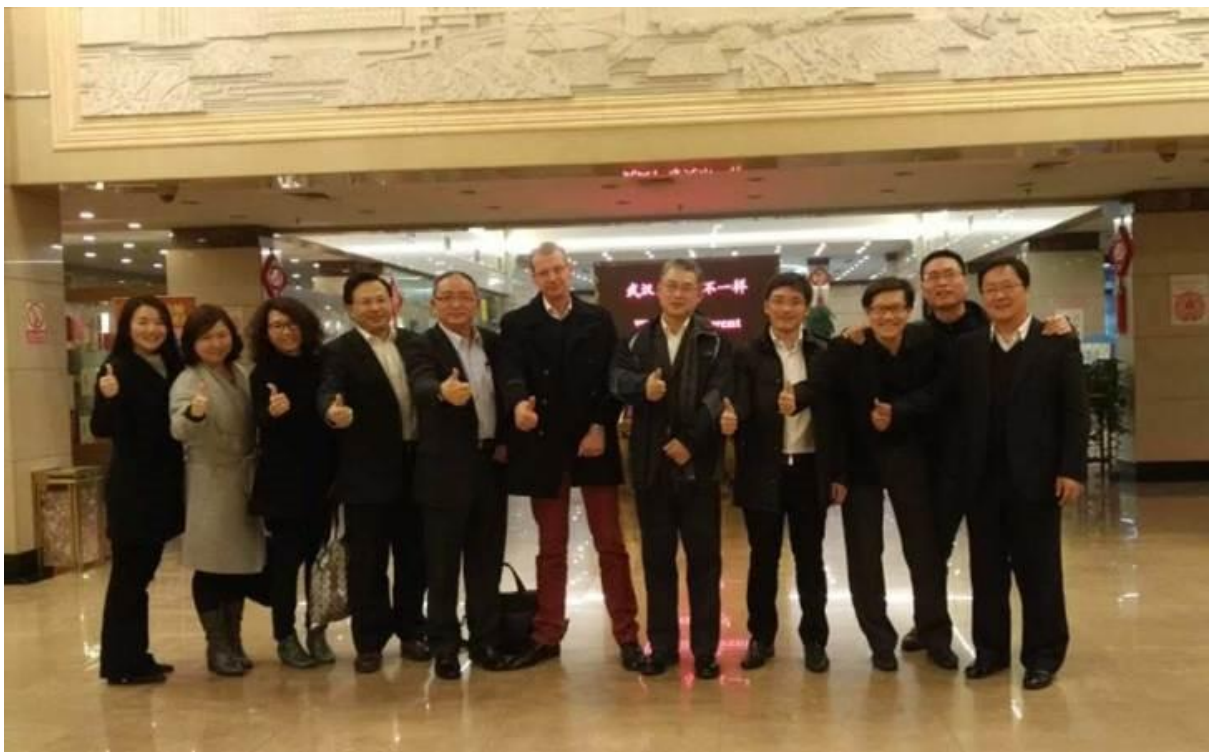
新加坡 CPG 集团高层及新加坡昂国集团代表访问武钢合影